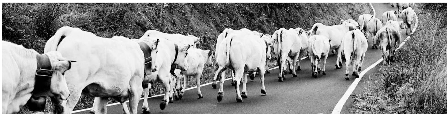
Nelle foto di Barbara Rezzoagli le immagini della transumanza dello scorso anno.